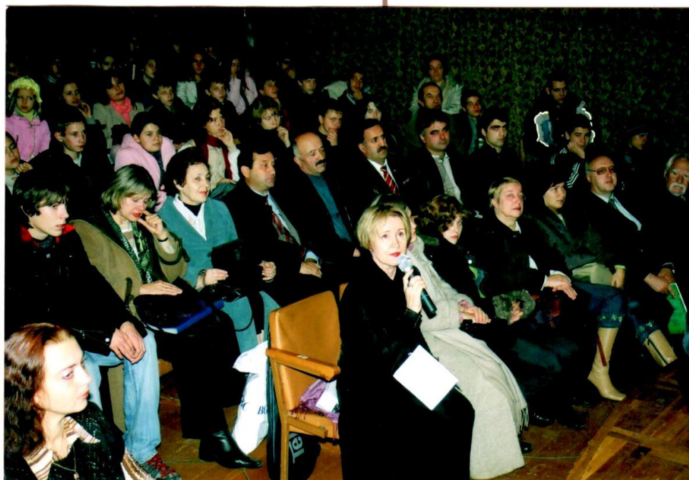
Обсуждение проблемы толерантности после показа спектакля «Дикий»

На мероприятие были приглашены представители Грузинской, Армянской и Азербайджанской диаспор г. Воронежа и сотрудники Миграционной службы. После спектакля мы активно обсуждали проблемы толерантности и национализма в нашем городе и в нашей стране. Сам спектакль произвел на всех очень большое впечатление, и, думаю, все в зрители в зале действительно задумались над вопросом терпимости вообще ко всем людям (не только другой национальности, но и инвалидом, старикам и т.д.).