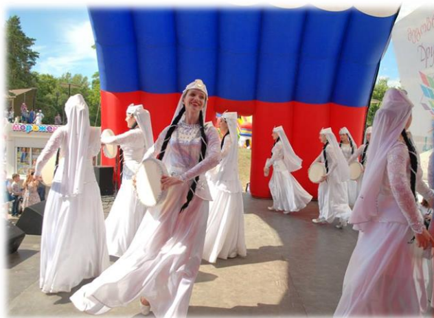
Хореографический ансамбль «Изюминка» (руководитель Меликян И.А.)