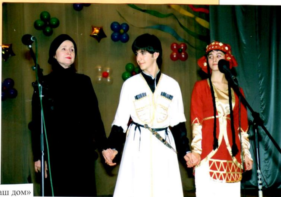
Концерт «Россия – наш дом»

В течение срока реализации проекта были поведены игровые программы для детей Армянской и Грузинской диаспор. Программы были рассчитаны на определенный возраст ребят: для маленьких ребят проводилась развлекательная программа, для старших был проведен экшн-тренинг на сплочение и раскрепощение.